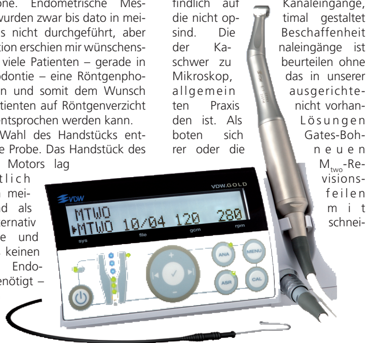
Der multifunktionale Endomotor VDW Gold mit integriertem Apex-locator.

Die Umstellungs- und Eingewöhnungsphase der Praxis auf das neue System dauerte etwa zwei Wochen. Zunächst trat folgendes Problem auf: Die dünnsten Feilen bogen sich stets an der Spitze um oder knickten ab. Außerdem reagieren sie empfindlich auf Kanaleingänge, die nicht optimal gestaltet sind. Die Beschaffenheit der Kanaleingänge ist beurteilbar ohne das in unserer Praxis nicht vorhandene Mikroskop. Als Lösung boten sich Gates-Bohrer oder die neuen M two -Revisionsfeilen mit schnei-