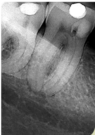
Abb. 1: Kontrollaufnahme vor der Wurzelbehandlung.